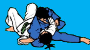
Kesa-gatame + bevrijdingen